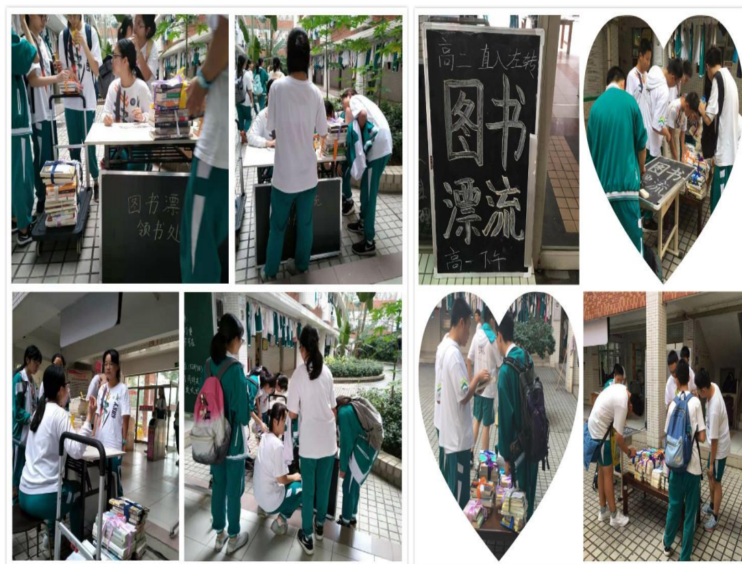
活动现场气氛热烈

12月5日中午,图书漂流活动在男女生宿舍指定地点正式开启,本次书籍的选择,参考了同学们的意见和年级组语文阅读推荐书目,具有广泛的阅读价值。图书漂流活动的图书来源于学校的图书馆与省立中山图书馆,共计400余册。漂流书库品目丰富,涵盖文学、推理、哲学、心理等内容,尽可能满足同学们的借阅需求。